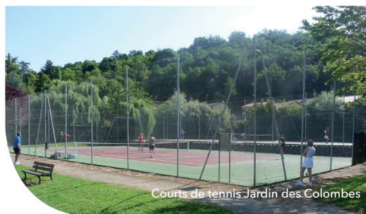
Courts de tennis Jardin des Colombes